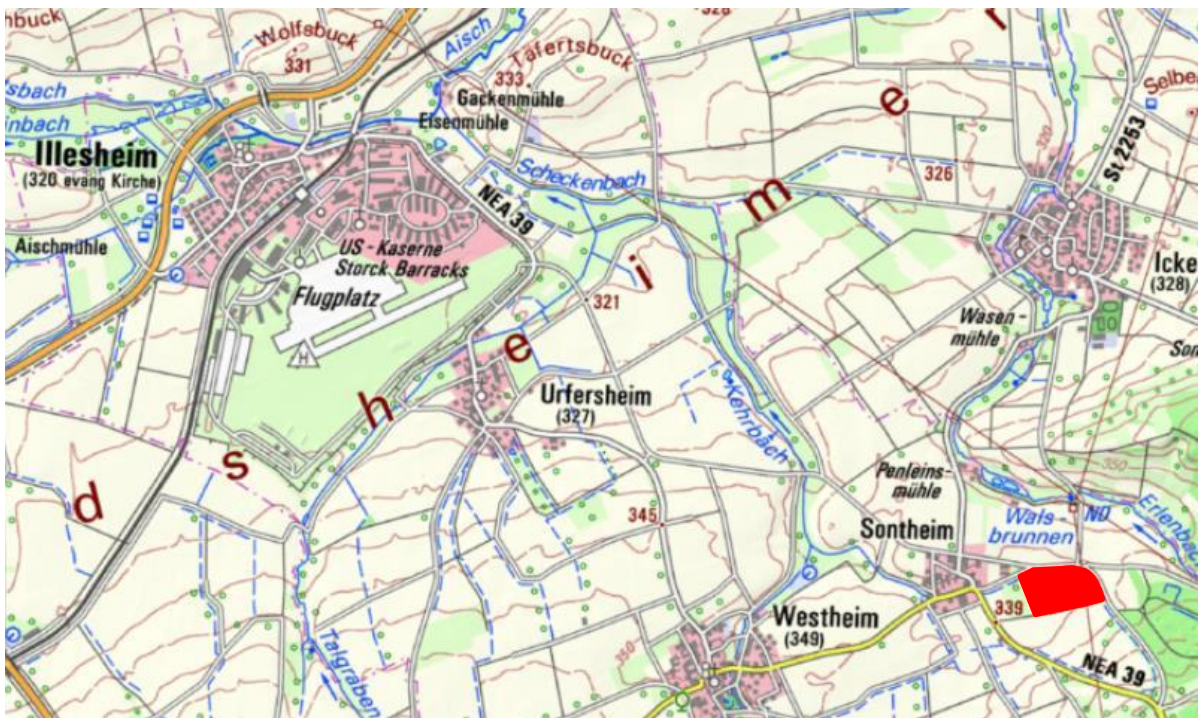
Kartenausschnitt mit Plangebiet

Der Gemeinderat Illesheim hat in der Sitzung am 06.12.2021 beschlossen, den Flächennutzungsplan der Gemeinde Illesheim im Bereich des parallel in Aufstellung befindlichen vorhabenbezogenen Bebauungsplanes Nr. 6 für das Sondergebiet „Solarpark Sontheim“ zu ändern. Die Änderung wird als 2. Änderung geführt. Geplant ist die Ausweisung einer Sonderbaufläche (S) gemäß § 1 Abs. 1 Nr. 4 BauNVO mit der Zweckbestimmung „Freiflächen-Photovoltaik“.