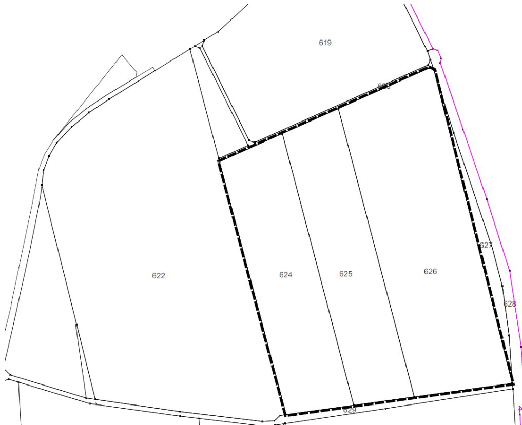
Abb. Geltungsbereich des Vorhabens (ohne Maßstab)

Ziel der Planung ist die Ausweisung eines Sondergebietes für eine Freiflächen-Photovoltaikanlage innerhalb eines nach dem Erneuerbaren-Energien-Gesetzes „landwirtschaftlich benachteiligten Gebietes“, um dem Bedarf an erneuerbaren Energien zu entsprechen.